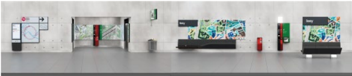
Ejemplo de instalación de dos módulos de ilustración en un lineal de andén.

Un módulo de ilustración es visible en la “Fabrique du Métro” de Saint Ouen.