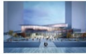
Saint-Denis Pleyel, Kengo Kuma Associates