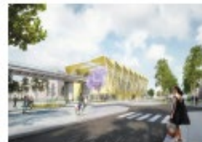
Orsay - Gif, Atelier Novembre