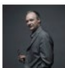
Thierry GROENSTEEN , historiador, teórico del cómic, curador de exposiciones del Museo del Cómic, profesor