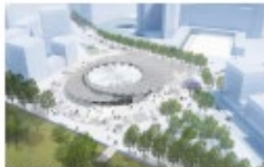
Villejuif IGR, Dominique Perrault Architectes

En este contexto, la arquitectura, el diseño y la cultura son un factor de cohesión social, de apertura y de apego a un territorio . Las estaciones del Gran París Exprés reflejarán el lugar del arte y de la cultura en el espacio público, y contribuirán así a promover la ambición cultural de los territorios en los que se encuentran.