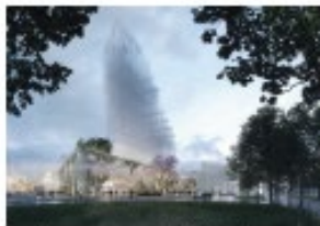
La Courneuve Six Routes, Chartier Dalix