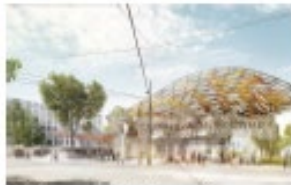
Clichy - Montfermeil, Miralles Tagliabue EMBT