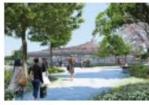
Noisy - Champs, Agence Duthilleul / AREP