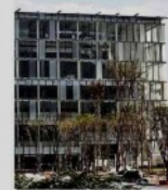
En octubre abre el Conjunto de Artes Escénicas de UdeG.