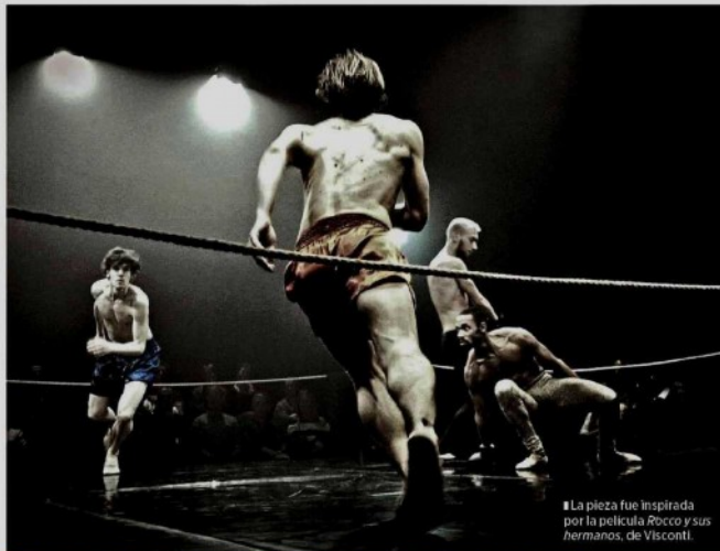
FIG. 45. BALLET NACIONAL DE MARSELLA

La pieza fue inspirada por la película Rocco y sus hermanos , de Visconti.