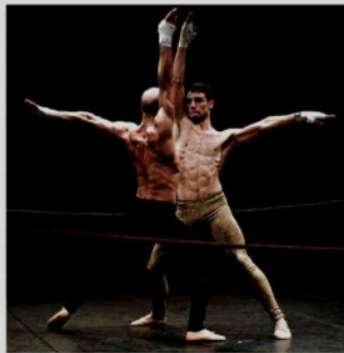
En esta pieza de Greco y Scholten, los bailarines devienen boxeadores y los boxeadores, bailarines. Se estrenó en 2011.

El control extremo del cuerpo y una disciplina de hierro son indispensables en ambos terrenos. Además, los bailarines se entrenan para compartir el espacio y la energía con el otro y siempre están conscientes del lugar del otro y de lo que hace en un espacio predeterminado: el escenario-el ring. Pero también algunos de los principios del movimiento, como el juego de piernas y cambio de sitio. El cuerpo